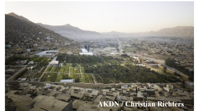
AKDN / Christian Richters

Dévasté par la guerre civile des années 90, ce site s'est relevé de ses ruines avec l'aide de la Fondation Agha Khan pour devenir un lieu populaire de promenade en famille.